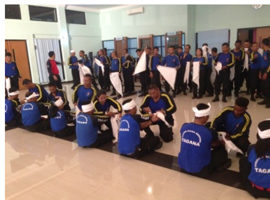
防災に関する国際協力（インドネシア）