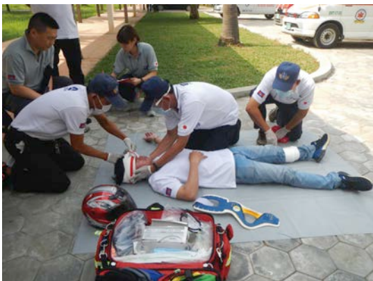
救急医療に関する国際協力（カンボジア・ラオス）

教材は WEB サイト ( https://khmerdesign.net ) で無償公開。